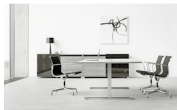
REISS ECO N2