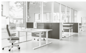
REISS ECO N2