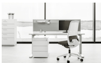
REISS SYSTEM 23/24