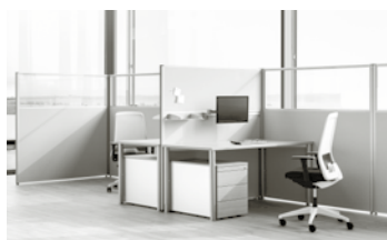
REISS SYSTEM 40/41