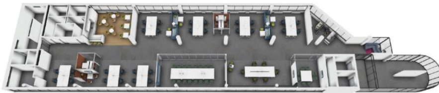
3D Visualisierung: Obergeschoss 1 (Geschossübersicht)