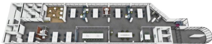
3D Visualisierung: Obergeschoss 1 (Geschossübersicht)

Neu eingerichtete Arbeitsplätze: 20 Baukosten gesamt: 1,8 Millionen Größe eingerichteten Fläche: 1.100 m 2 Realisierung: im Mai 2016