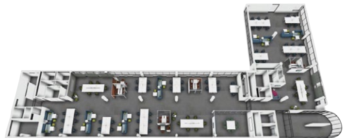
3D Visualisierung: Obergeschoss 2 (Geschossübersicht)